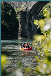
BASE DE CANOË-KAYAK PADDLE CÔTÉ SAINT-CIRGUE